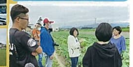
グレイテスト洞爺湖サニックス

映画のロケ地にも使われた、畑に囲まれた絶景ビューの車中泊スポット。みんなも収穫した新鮮野菜で贅沢な食事と時間を楽しみました。