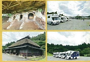
小石原伝統産業会館

江戸時代から約400年の歴史を誇る伝統工芸「小石原焼」の作品を、先人の古作から現代の窯元の新作まで展示。また、陶芸体験工房や盛り皿も併設されています。街散策も楽しい。