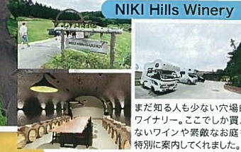
NIKI Hills Winery

開催日：7月27日(月)～29日(水) 開催エリア：北海道釧田郡真狩村、 真狩焚火キャンプ場、グレイテスト洞爺湖サニックス 他