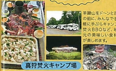
真狩焚火キャンプ場

羊蹄山をドーンと目の前に、みんなで手軽に手ぶらキャンプ。焚火BBQなど、地元の良い食材が楽しめます。