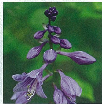
1周30分ほどの森の散策路に囲まれた「RECAMP摩周」は清潔感のあるキャンプ場。コバギボウシ(右)やクルマユリ(左)などの花も咲いていた