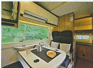
上/キャンピングカーの旅なら電源付きの大きなサイトが便利だ。左/車内にはリビングや寝室、トイレ、空調もあり快適そのもの

北海道ノマドレンタカー 女満別店 北海道網走郡大空町女満別本通5-1-6 Tel: 0123-21-8572 https://nomad-r.jp/