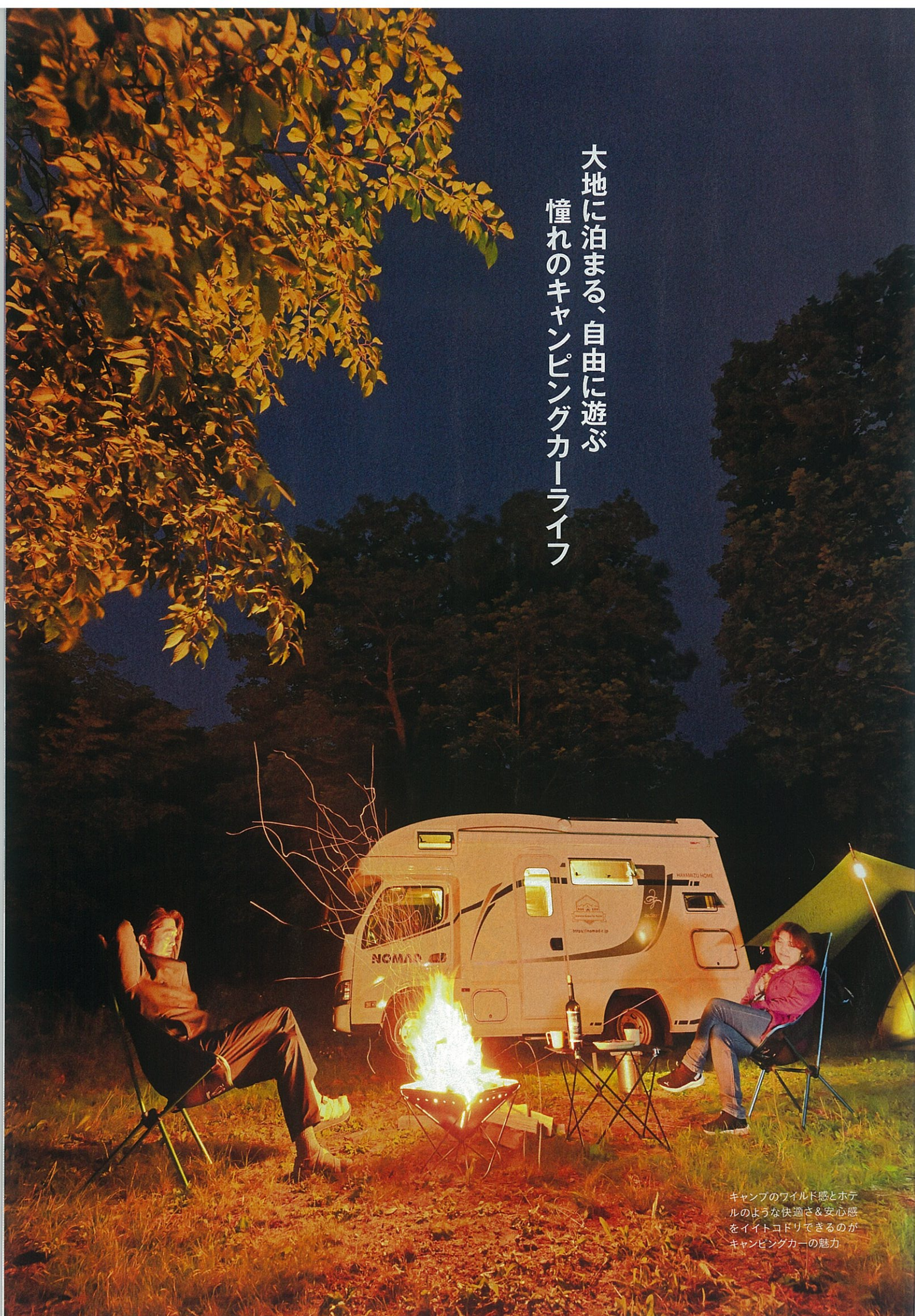
キャンプのワイルド感とホテルのような快適さ&安心感をイイトコドリできるのがキャンピングカーの魅力